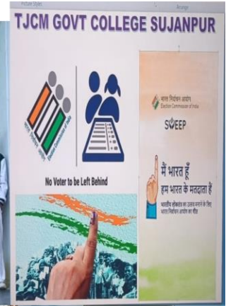
Electoral Literacy Club of Govt College Sujanpur Tihra organized awareness programs to educate and engage young voters under SVEEP on 10 October and 03 November 2025