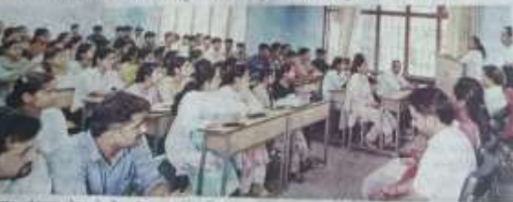
सुजानपुर : छात्रों को एन.एस.एस. व रोवर रेजंस इकाइयों में सहभागिता बढ़ाने के लिए किया प्रेरित।

सुजानपुर, 3 जुलाई (अश्वनी)। सुजानपुर महाविद्यालय सुजानपुर टीहरा में छात्रों को एन.एस.एस., एन.सी.ए. व रोवर रेजंस इकाइयों में सहभागिता बढ़ाने के लिए किया प्रेरित। इस दौरान विभिन्न कार्यक्रमों के माध्यम से छात्रों को इन कार्यक्रमों के महत्व और लाभों के बारे में बताया गया। छात्रों को इन कार्यक्रमों में भाग लेने के लिए प्रोत्साहित किया गया।