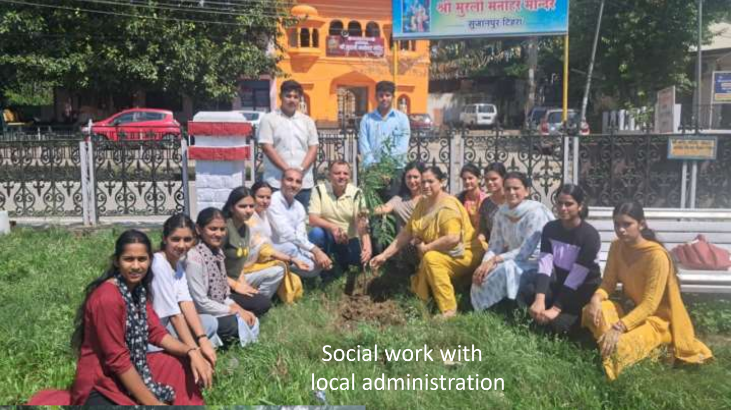
Social work with local administration